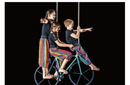
Ende Januar zeigten die Kinder und Jugendlichen in der Manege ihr Können.

In der Zirkusschule «Grissini» werden Kinder und Jugendliche zu Artisten. Am Ende jedes Semesters wird der Trainingsraum zur Manege.