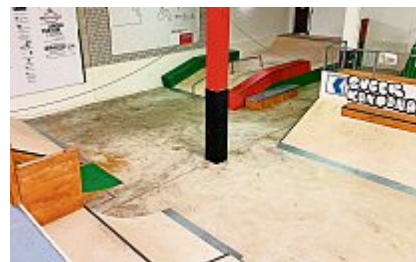
Bald feiert die Freestyle-Halle Zug ihr einjähriges Jubiläum.

Am 19. Januar 2019 öffneten sich die Tore der Freestyle-Halle Zug zum ersten Mal. Nun feiert sie am 28. Februar die einjährige Jubiläumsparty.