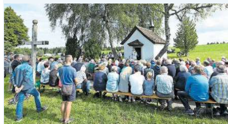
Die Besucher des letztjährigen Bärgfäschts beim Gottesdienst.