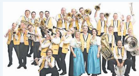
Die Schlossbergmusikanten Uster spielen am 18. August in Oberägeri.